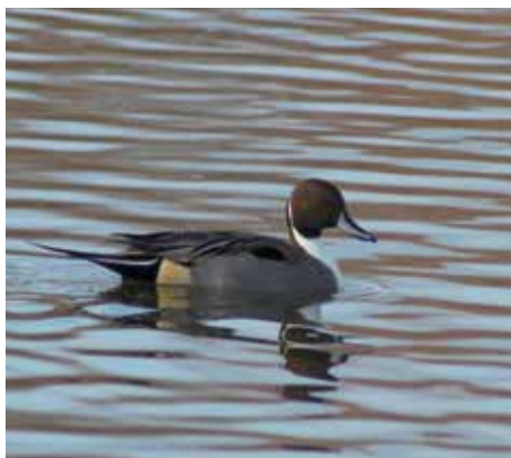
Elegantní samec severské kachny ostralky štíhlé trávil v letošní zimu v Kralupech nad Vltavou.