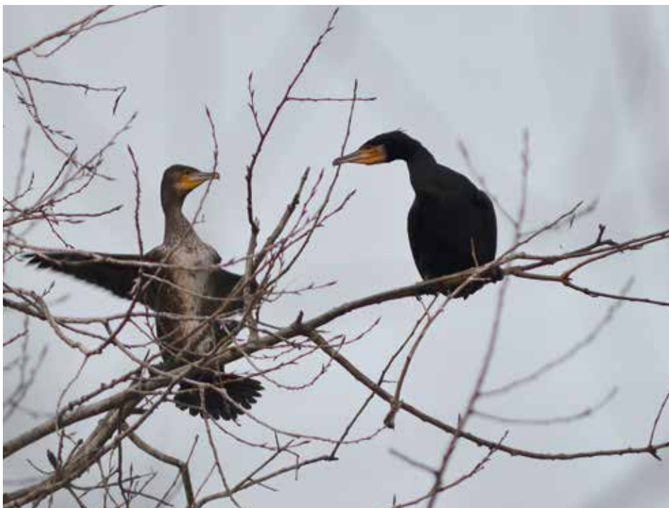
Kormoráni velcí v Libčicích nad Vltavou Přistávající mladý pták (vlevo) se zdraví se starším kolegou.