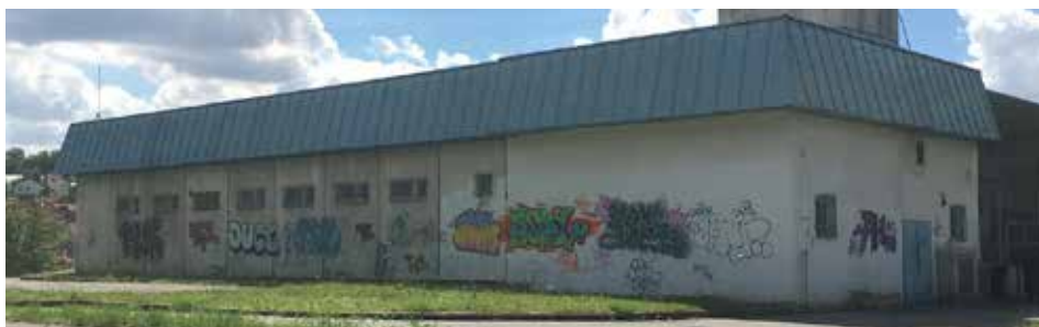
Takhle zatím vypadá zadní strana budoucí policejní stanice.

Náš seznam nejspíš obsahuje i utopické nesmysly. To by bylo jen dobře. Ale jak to poznat? Žijeme ve městě řízeném spolkem iluminátů, kteří se o plány rozvoje svěřeného spravovaného prostoru neradi dělí. Skoro by se až chtělo spekulovat, že záměrně. Mýlí se ten, kdo by došel k závěru, že je to jen proto, že v přehrášili nekonceptních plánů veřejných se dobře skryjí ty naprosto konkrétní soukromé?