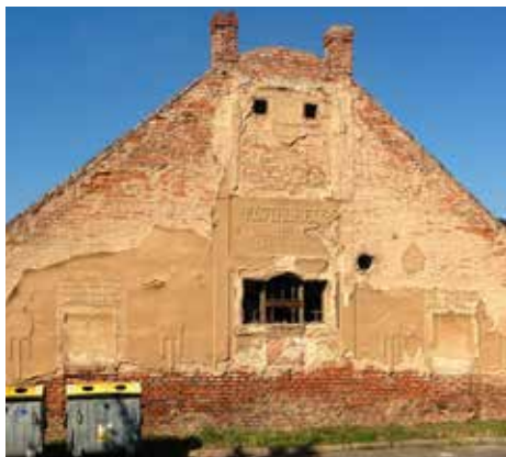
Takhle znají Černou horu ti, kteří spěchají na vlak Zahradní ulicí. Prázdnou a zchátralou.

Bohoušek měl zvláštní humor a pamětníci dodnes vzpomínají na některé jeho rázovité postupy. Například když přelil panáka