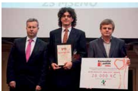
Zasloužené ocenění Komunální politik roku za ekologii (snížení energetické náročnosti provozu historické školní budovy). Letos starosta kandiduje do Senátu. Proč ne, když je moudrý?

v okolní krajině, víme, že musíme podporovat místní firmy a továrny v rozvoji, ale chceme dbát na to, aby město neztratilo svůj charakter, je stále o čem přemýšlet.