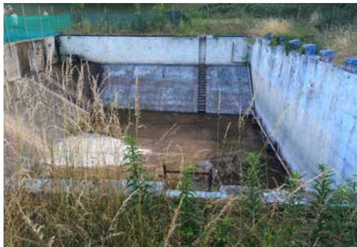
Zapomenutá ozdoba libčické plovárny.

domů. A až se zbourají, tak tam dáme do prostředí třeba betonové květináče. Odborník, který by řekl, které dva domy koupit a zbourat (nebo tři, čtyři, žádný?), či jak to vůbec celé udělat, by byl drahý. Náměstí přece pozná každý, na to nejsou třeba školy.