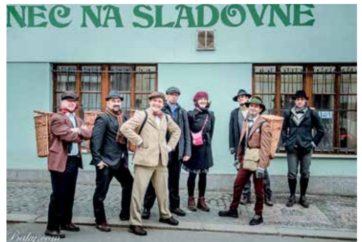
Wolákův spolek Natvrdlí. Ale natvrdlí věru není. Že by měli smysl pro humor a recesi?