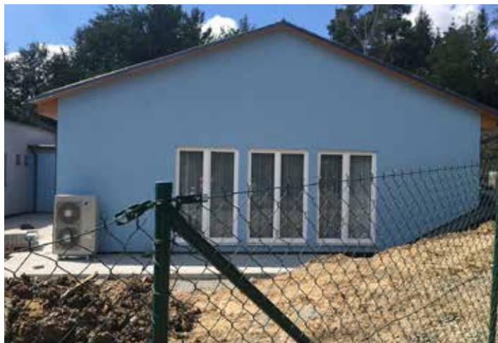
Funkční určitě je. Jen nepasuje... ..ke zbytku.

Školka: Hrozně dlouhou dobu se nedělo vůbec nic. Pak vznikl projekt na výstavbu dvou tříd, který byl na poslední chvíli nahrazen jiným pouze s jednou novou třídou. A největší „výhodou“ finální podoby přístavby je, že „projekt byl v ceně“, tudíž se „zbytečně nevyhazovaly peníze“ – i když proklamovanou dotaci město nakonec nezískalo.