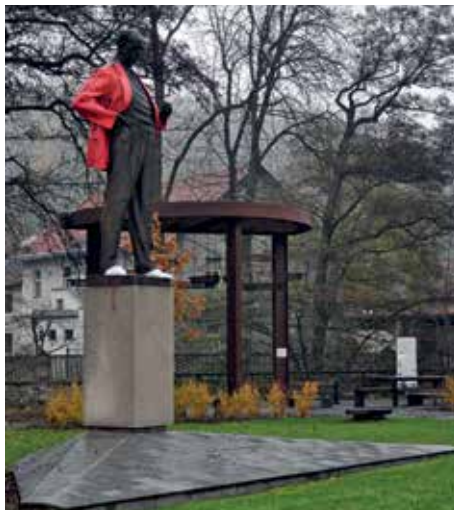
... Antonína Zápotockého v momentálně slavnostním červeném saku. Co se mnou asi bude?