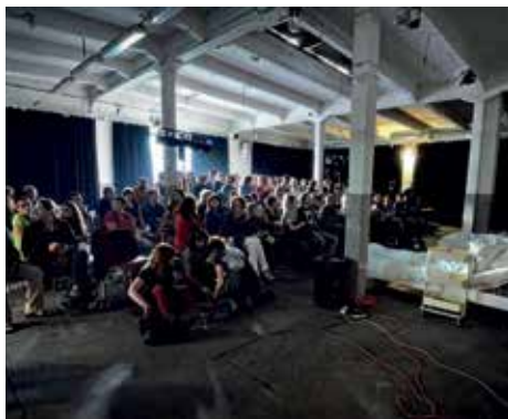
V zákolanské Piance právě vystupuje divadlo V.A.D. s hrou Sága rodu Rassini .