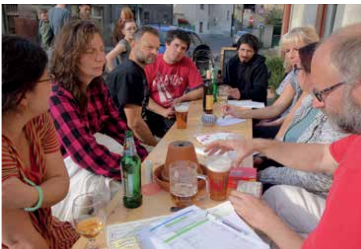
Takhle se sedí a debatuje před novou zákolanskou kavárnou.