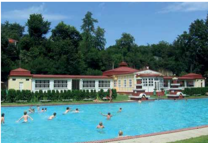
Městské lázně ve Mšeně jsou architektonický skvost z roku 1932.