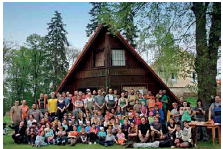
Velvarská pospolitost kvete. Na obnově prvorepublikové plovárny na Malovarském rybníku pracují dospělí i děti.